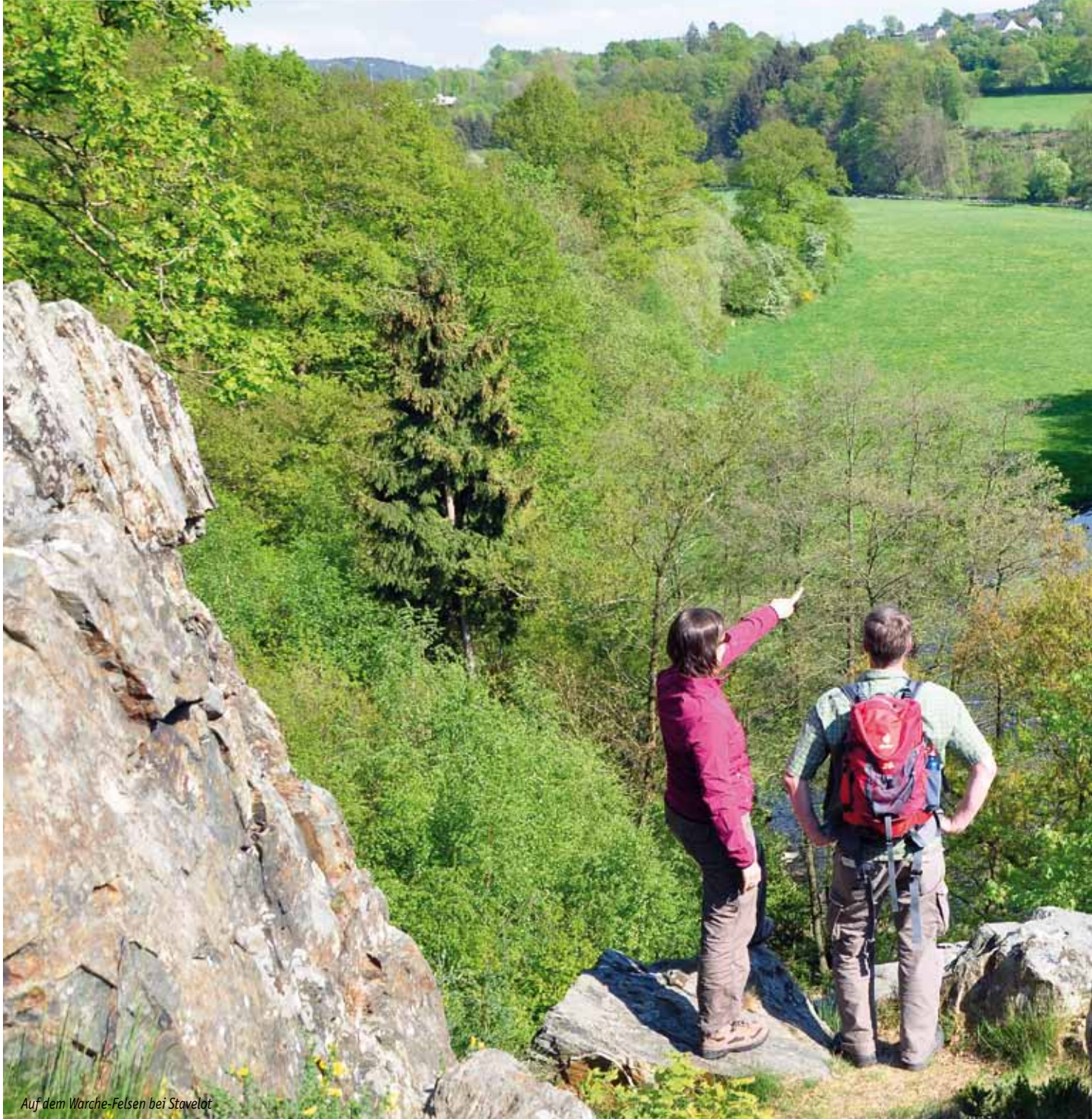
Auf dem Warche-Felsen bei Stavelot